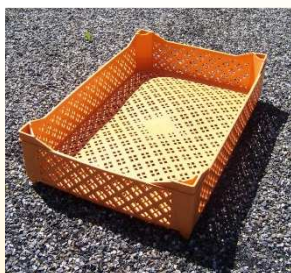
Cagette ajourées avec réhaut

Réhaut : hauteur de 20 mm sur les quatre coins de la cagette