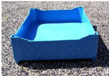
Cagette pleines avec réhaut

La gamme de produit avec même dimensionnel :