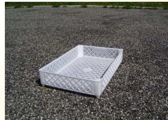
Cagette ajourées sans réhaut