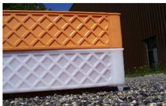
Cagette pleines sans réhaut

La gamme de produit avec même dimensionnel :